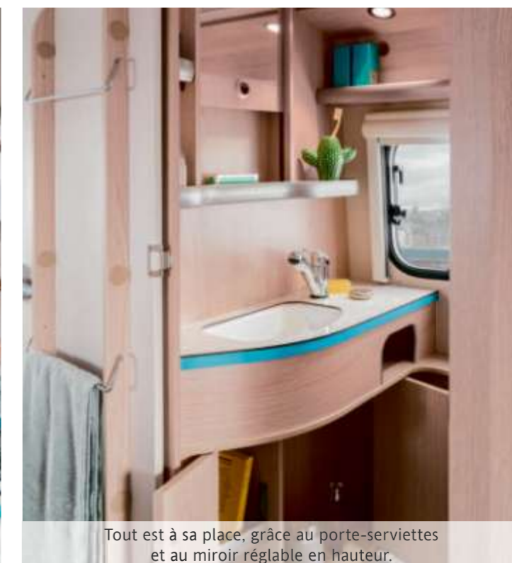
Tout est à sa place, grâce au porte-serviettes et au miroir réglable en hauteur.

Le charme rétro de l'ERIBA Troll 530 Ocean Drive se reflète à la fois à l'extérieur, par ses lignes, son design et ses coloris, mais également à l'intérieur. Ce qui n'empêche pas la caravane ERIBA d'avoir un rendu très moderne. Tout comme dans la Rockabilly, l'intérieur exclusif de la chambre, la cuisine et le cabinet de toilette satisfera aux plus hautes exigences en matière de confort et de fonctionnalité. Bienvenue dans votre diner particulier !