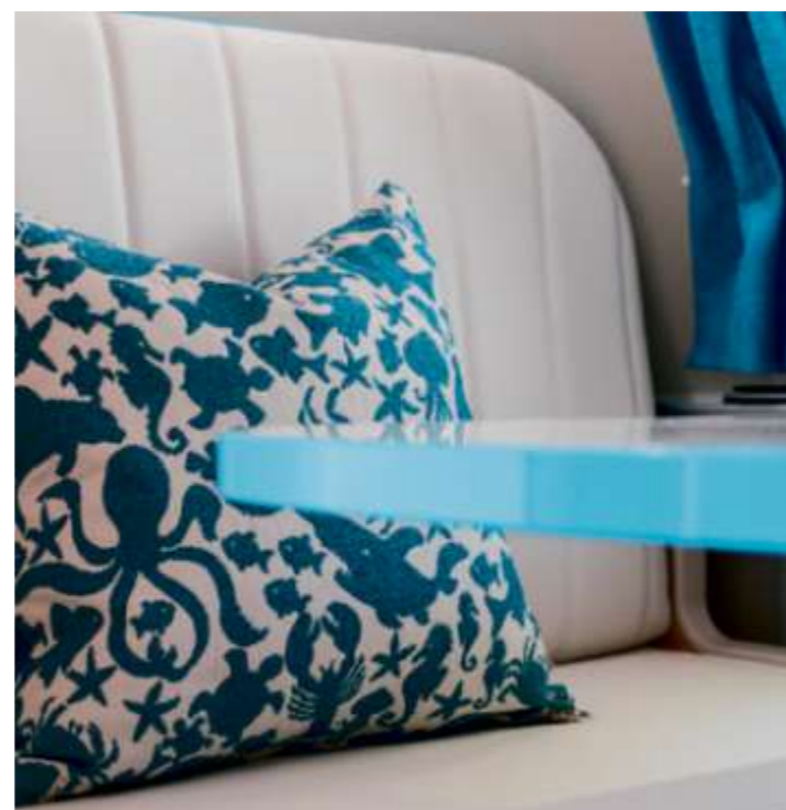
Les coussins haut de gamme viennent souligner la tonalité vive des couleurs.

Ambiance Miami Beach. L'ERIBA Troll 530 Ocean Drive invite à revivre l'ambiance « plage » des années 1950. Sa forme compacte et ses coloris extraordinaires font de cette caravane d'ores et déjà culte un véritable accroche-regard. La combinaison de blanc et de bleu océan incarne le style rétro à l'état pur. Tout est réuni pour rêver et se détendre en s'imaginant sur une plage de Miami.