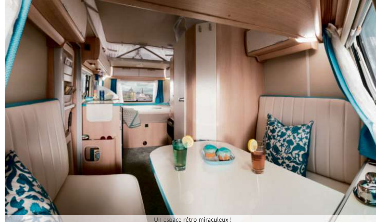
Un espace rétro miraculeux !