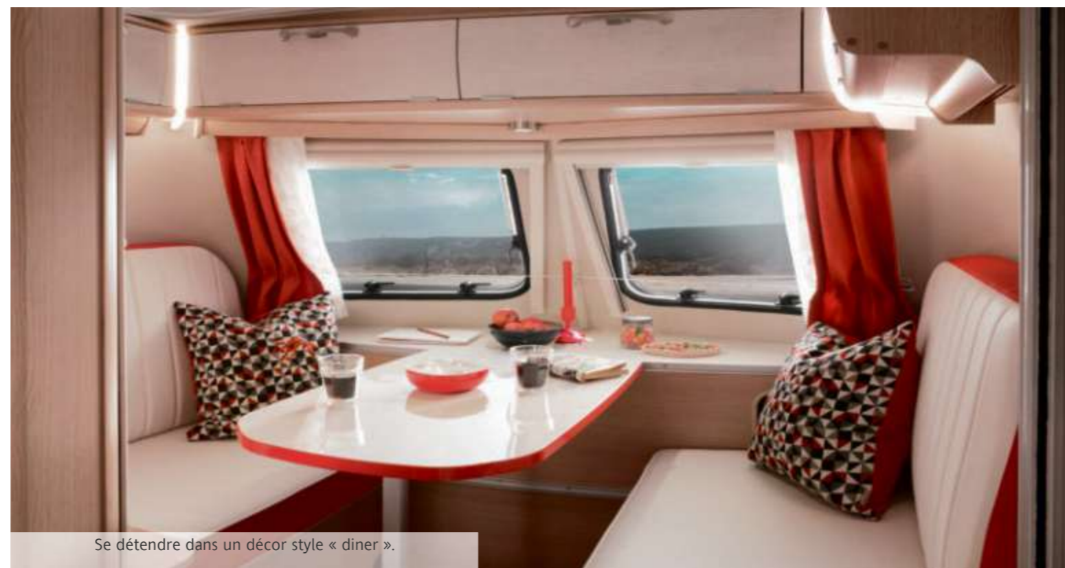
Se détendre dans un décor style « diner ».

Cette caravane ERIBA est une ode sur roues à l'ambiance et à la musique des années 1950. Cela se reflète aussi bien dans le design que dans les coloris, caractéristiques de cette période. Rouge en bas et blanche en haut, la Troll 530 Rockabilly reprend les codes de cette période considérée comme révolue, en termes de design de véhicule et de couleurs. Chaque excursion se transforme ainsi en voyage dans le temps.