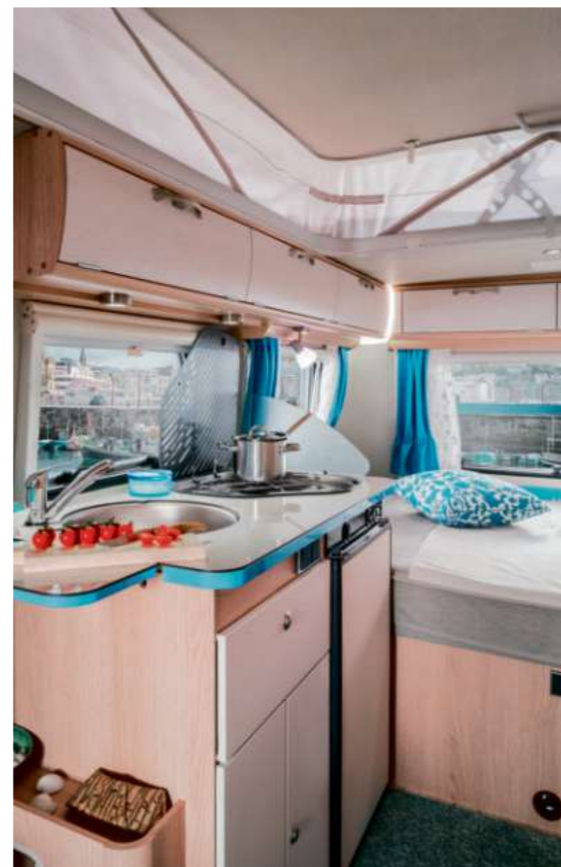
Rallonge du plan de travail et couvercle d'évier en option, pour des moments alliant confort et plaisir.