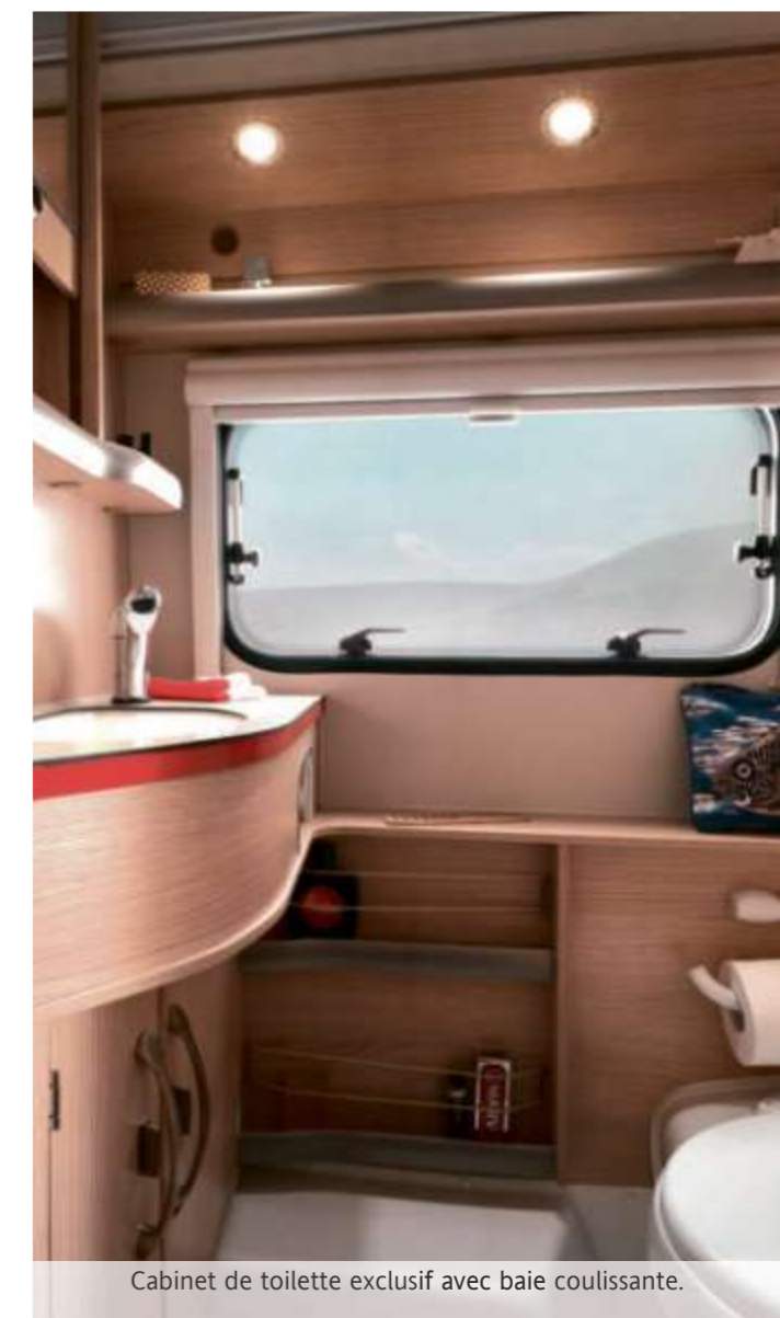
Cabinet de toilette exclusif avec baie coulissante.