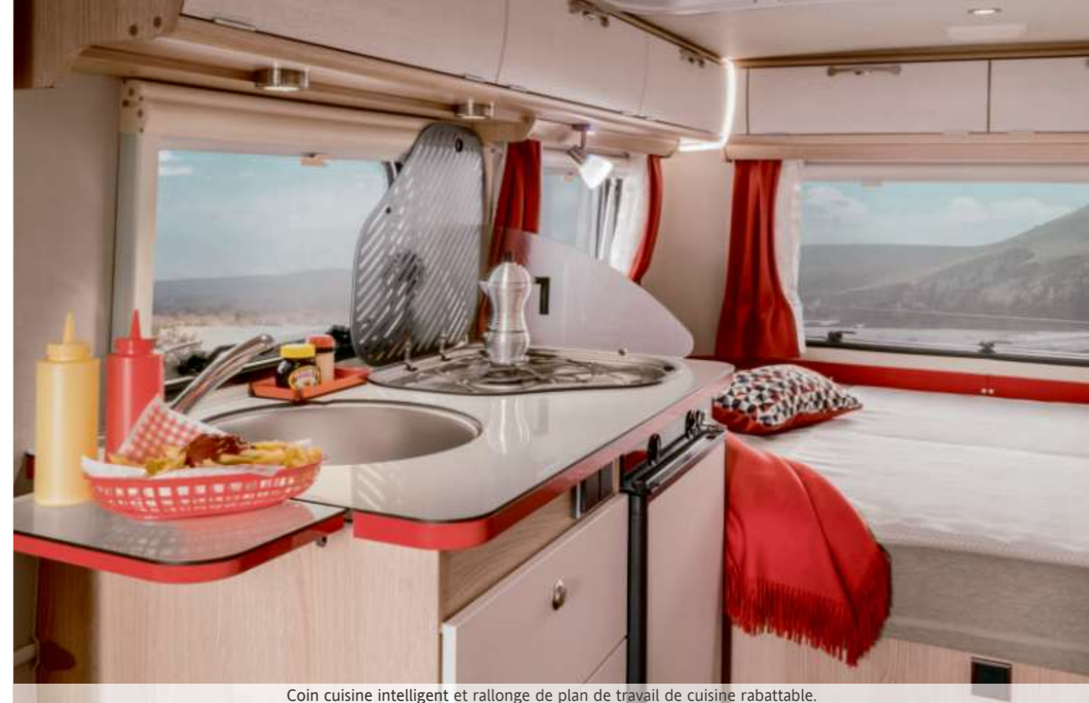
Coin cuisine intelligent et rallonge de plan de travail de cuisine rabattable.

Embarquez pour un retour vers le futur, dans un décor rétro chic aux équipements intelligents et technologiquement sophistiqués, pour répondre à tous vos besoins. Les coloris vifs de l'espace cuisine lui confèrent le charme typique des diners américains. Profitez de ce mode de vie tout particulier sur les banquettes grand confort à haut dossier. À cela s'ajoutent les équipements exclusifs de la chambre et du cabinet de toilette, pour des voyages inoubliables.